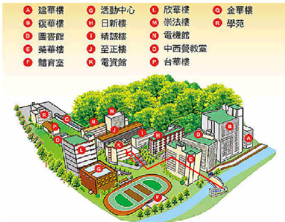
中華科大校內地圖 (台北市南港區研究院路三段 245 號)